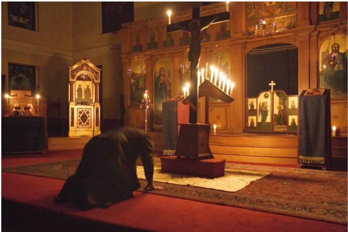
مَعَا : اِحْكَم اِحْصَم

اَسْبِ كَلَا اَلِهَ اِوَاخِي اِي وَتَك . اَمَعَصَد عَصْر اَمَعَاوُو حَا عَجِنَا اِحْكَم اِحْصَم : حُر اِوَا عَهْصَا هَا قِرَا اَعَهْصَا . هَا قِرَا مَهْصَا . اَلِهَ اِي وَكَلَا هَا اِي وَعَاوُو حَم كَا تَسْبُرَا . اُو اِي سُرَا سُرَا مَبْرَا هَا هَا حَا حَا اِحْكَم اِحْصَم اِحْصَم : مَن اِي عَهْصَا مَهْصَا . اِوَا حُرَا وَوَسْطَا اِي اِي اِي وَطَا قِرَا مَن . اِي اِي اِي مَهْصَا . اِوَا اِي حَا : اِي اِي اِي اِي مَن اِي اِي اِي مَن اِي اِي اِي اِي اِي اِي اِي اِي اِوَا اِي حَا :